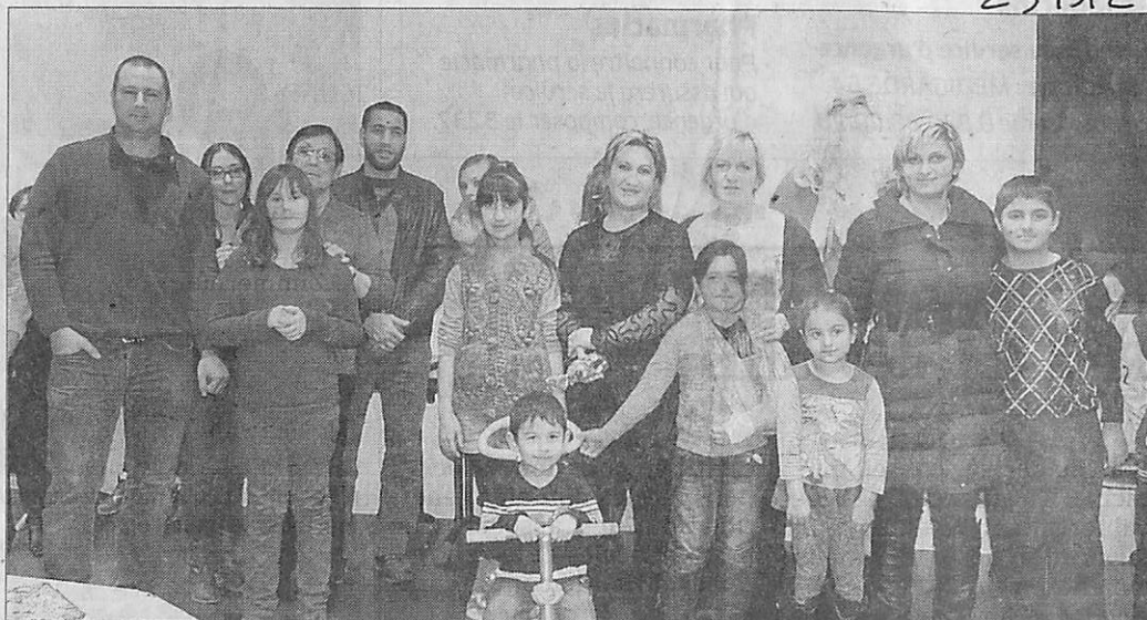
■ Une bonne occasion pour les salariés de l'association de se retrouver.

Ecoval, association intermédiaire nancéienne visant à la réinsertion, permet à des personnes sans emploi de reprendre une activité économique, par le biais de missions dans les entreprises, collectivités, associations ou chez des particuliers, pour le ménage, le repassage, les travaux de peinture.